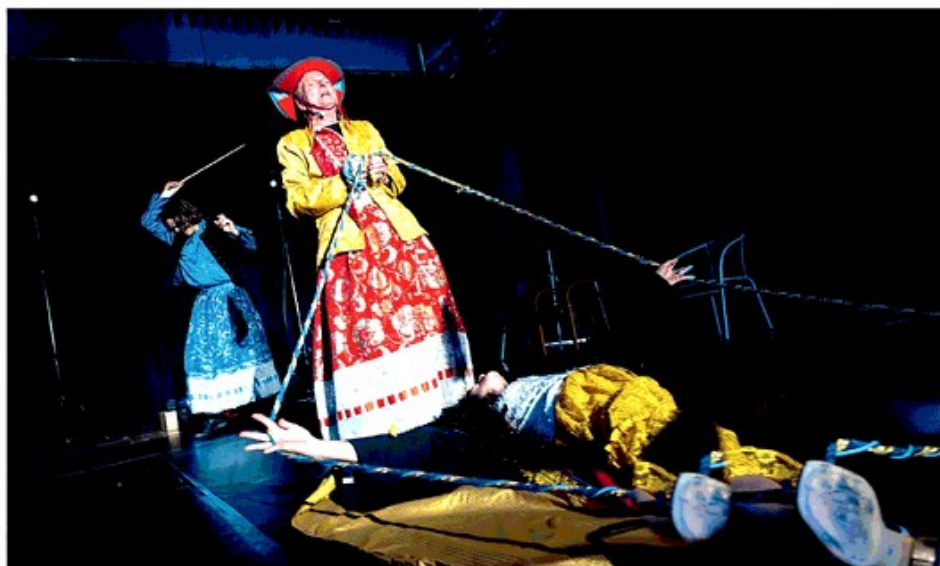
Le nuvole di Amleto in scena al Menotti, da stasera a domenica

Il titolo è Le nuvole di Amleto , e come tutte le creazioni del gruppo è un oggetto difficile da inquadrare. Il testo intreccia le vicende di Amleto, principe di Danimarca a cui il fantasma del padre ucciso chiede di essere vendicato, alla biografia di Shakespeare, che nel 1596 perse l'unico figlio maschio, Hamnet, e cinque anni più tardi il padre. Lutto, dolore, vendetta sono i nuclei ardenti di uno spettacolo che punta alla sfera emotiva dello spettatore con l'incanto dei rituali ancestrali. «Perché fare teatro oggi – si chiede e ci chiede Barba – mentre capitano cose inimmaginabili? Il nostro spettacolo non dà risposte, il nostro compito è fare domande». E la domanda di fondo è urgente, alla luce della violenza che domina nel mondo: «Che cosa ci dice oggi la vicenda di un padre il cui fantasma appare al figlio e gli lascia il compito di uccidere e vendicarlo? Qual è l'eredità che abbiamo ricevuto