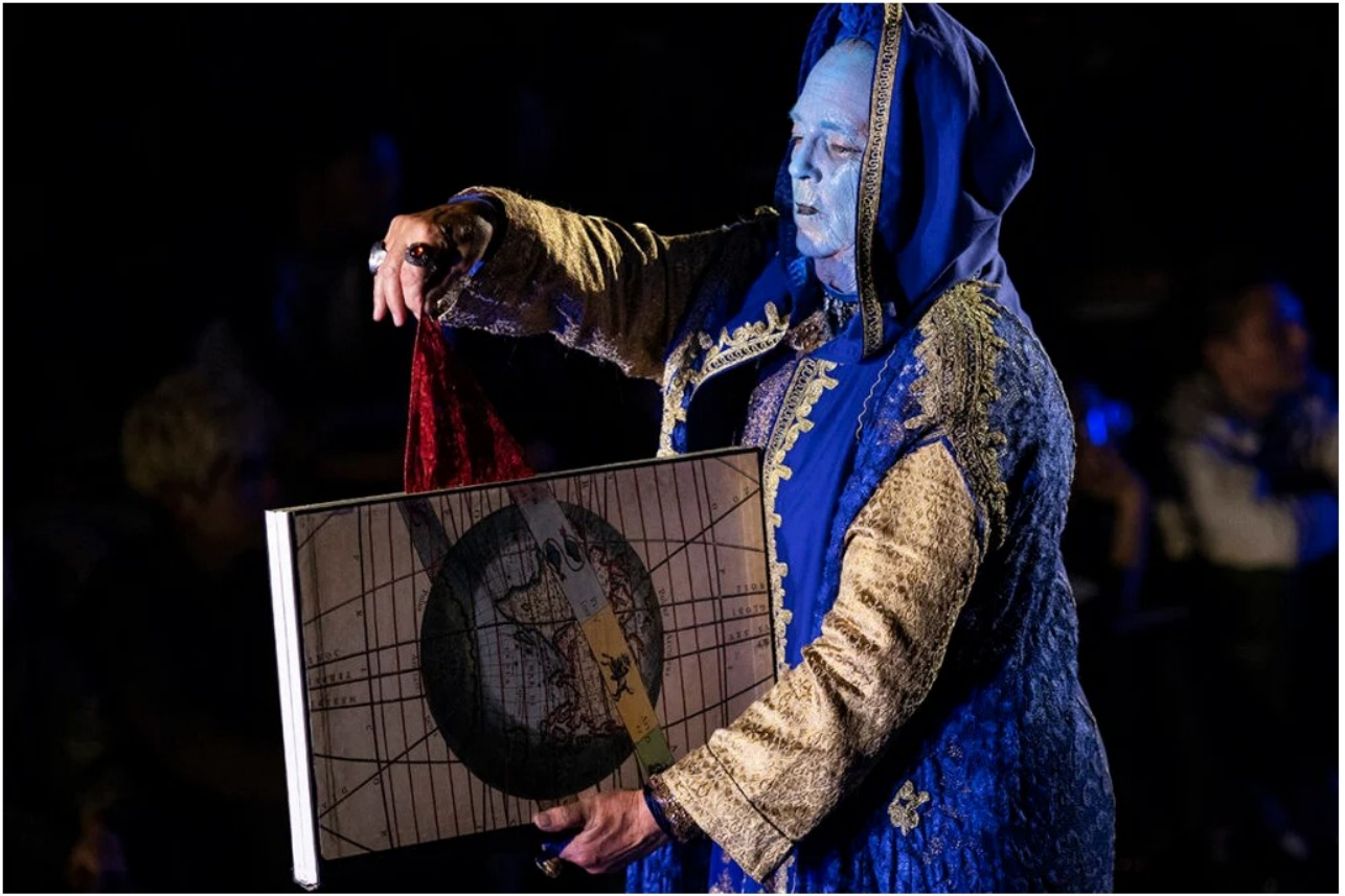
Le nuvole di Amleto