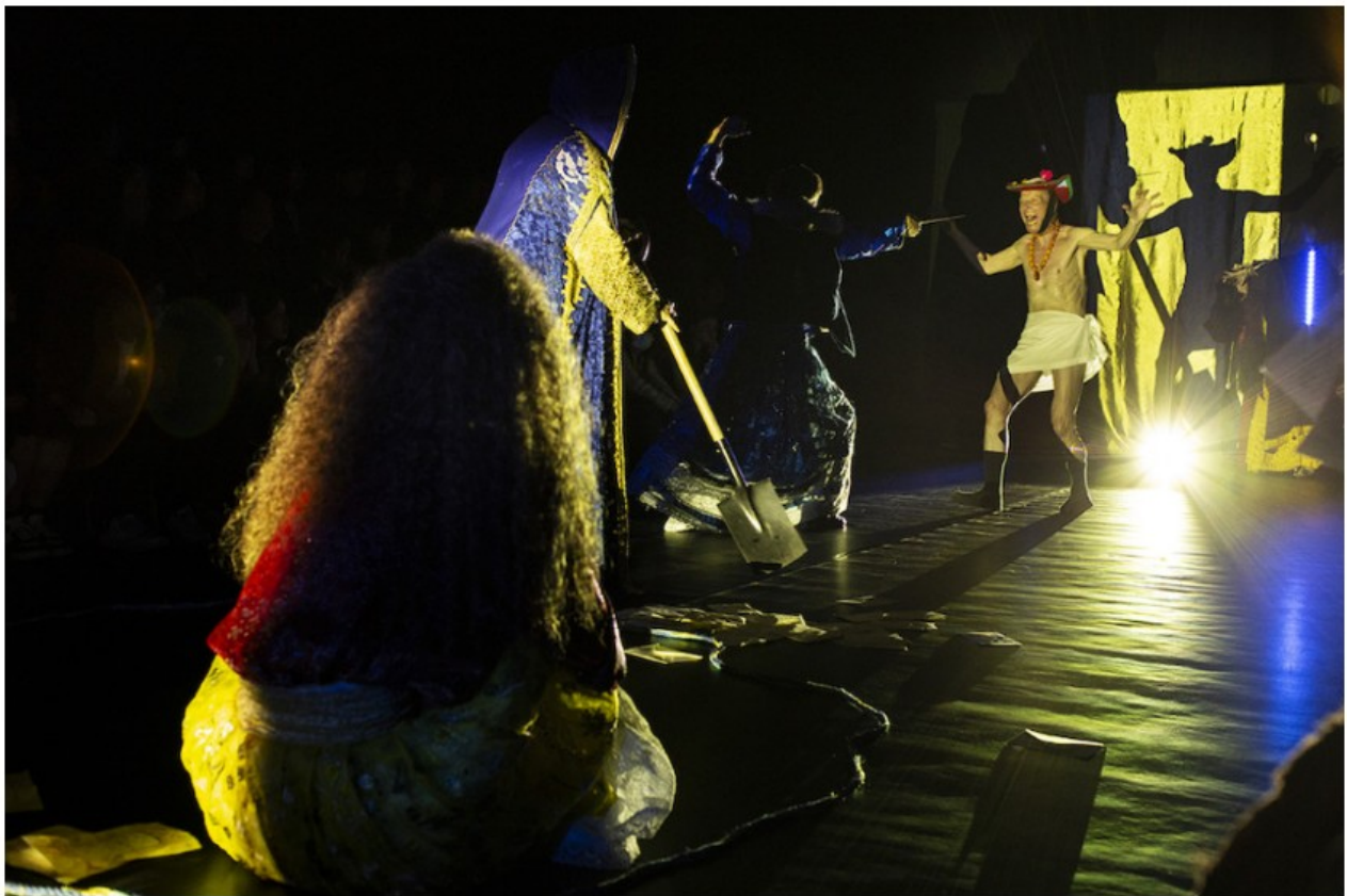
"Le nuvole di Amleto", regia Eugenio Barba.