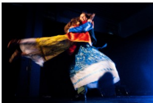
Foto di scena: Le nuvole di Amleto - Odin Teatret

MAGGIO 9, 2025 □ NESSUN COMMENTO >> CLAUDIO ELLI