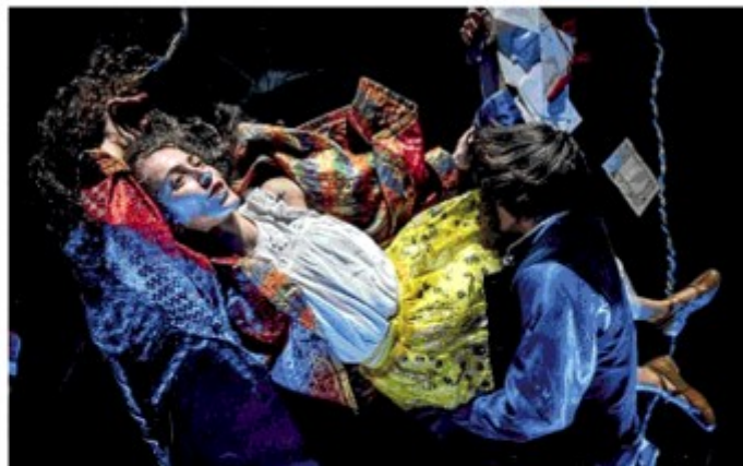
Generazioni ed eredità Una scena di «Le nuvole di Amleto», liberamente ispirato alla tragedia di Shakespeare

«I nostri spettacoli spesso si rivolgono a pochi spettatori creando una prossimità spaziale ed emotiva, con alcuni nascono legami profondi, alcuni restano anonimi, altri si manifestano con aiuti e la volontà di presentare i nostri spettacoli nelle loro città. Alcuni di loro sono critici, docenti universitari, politici che nutrono stima e «affetto» verso di noi. «Il popolo segreto» dell'Odin non è solo un sostegno emotivo, operativo ed