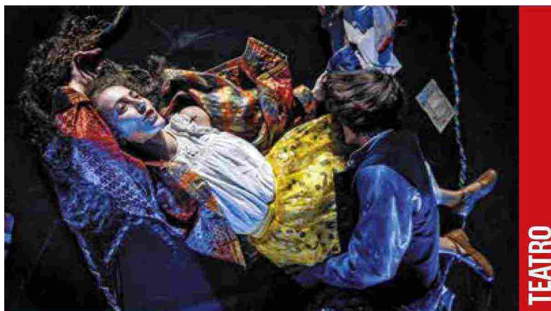
"Le nuvole di Amleto".

Odin Teatret mette in scena passioni e legacci della paternità. Nel nome di Shakespeare. E del suo bambino morto a 11 anni